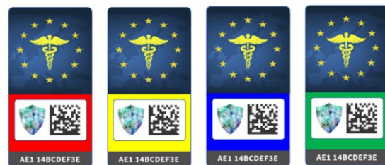
Abb. 1: Beispiele für AV Health Tag Designs