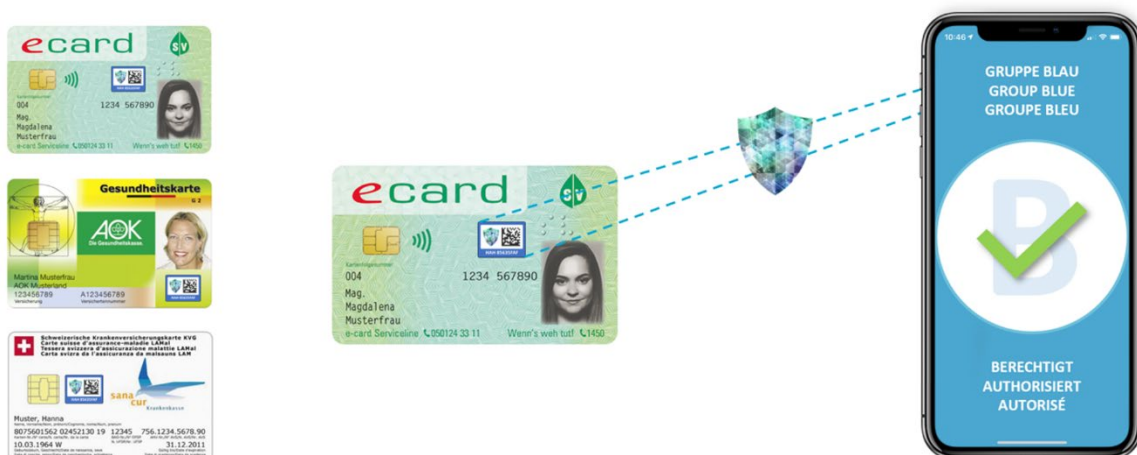
Abb. 2: Authentifizierung mittels der Authentic Vision App

Die Aktivierung der Tags kann von jeder beliebigen Gesundheitsbehörde (medizinische Einrichtung, Krankenhaus oder Arztpraxis) mit Angabe von Privilegien und Zugriffsrechten mit Hilfe der kostenlosen AV "Admin" App auf jedem Smartphone durchgeführt werden.