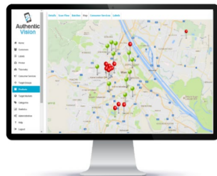
Abb. 3: Darstellung der Positionsdatenansicht des Authentic Vision Web Portals

Dieses Verfahren ist 100% datenschutzkonform (gem. DSGVO), da die Verbindung zwischen einer Person und ihrer Klassifizierung oder ihrem Testergebnis auf die physische Verbindung zwischen dem Tag und dem jeweiligen ID-Dokument beschränkt ist. Zu keinem Zeitpunkt werden persönliche Informationen im Label-System gespeichert. Nur die Klassifizierungs- oder Testergebnisse werden gespeichert.