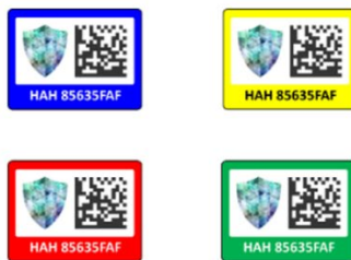
Kleines Format (16x12 mm)